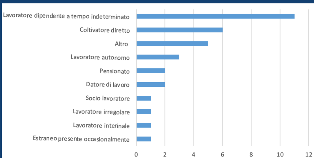
Distribuzione degli infortuni mortali nella Regione del Veneto per ruolo. Gennaio - Settembre 2022